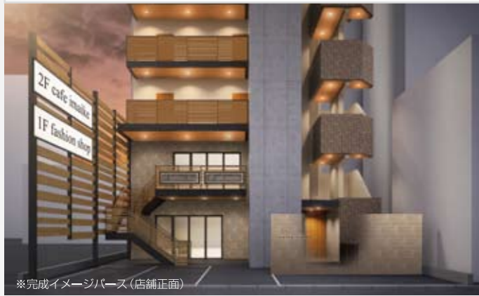
※完成イメージパース(店舗正面)