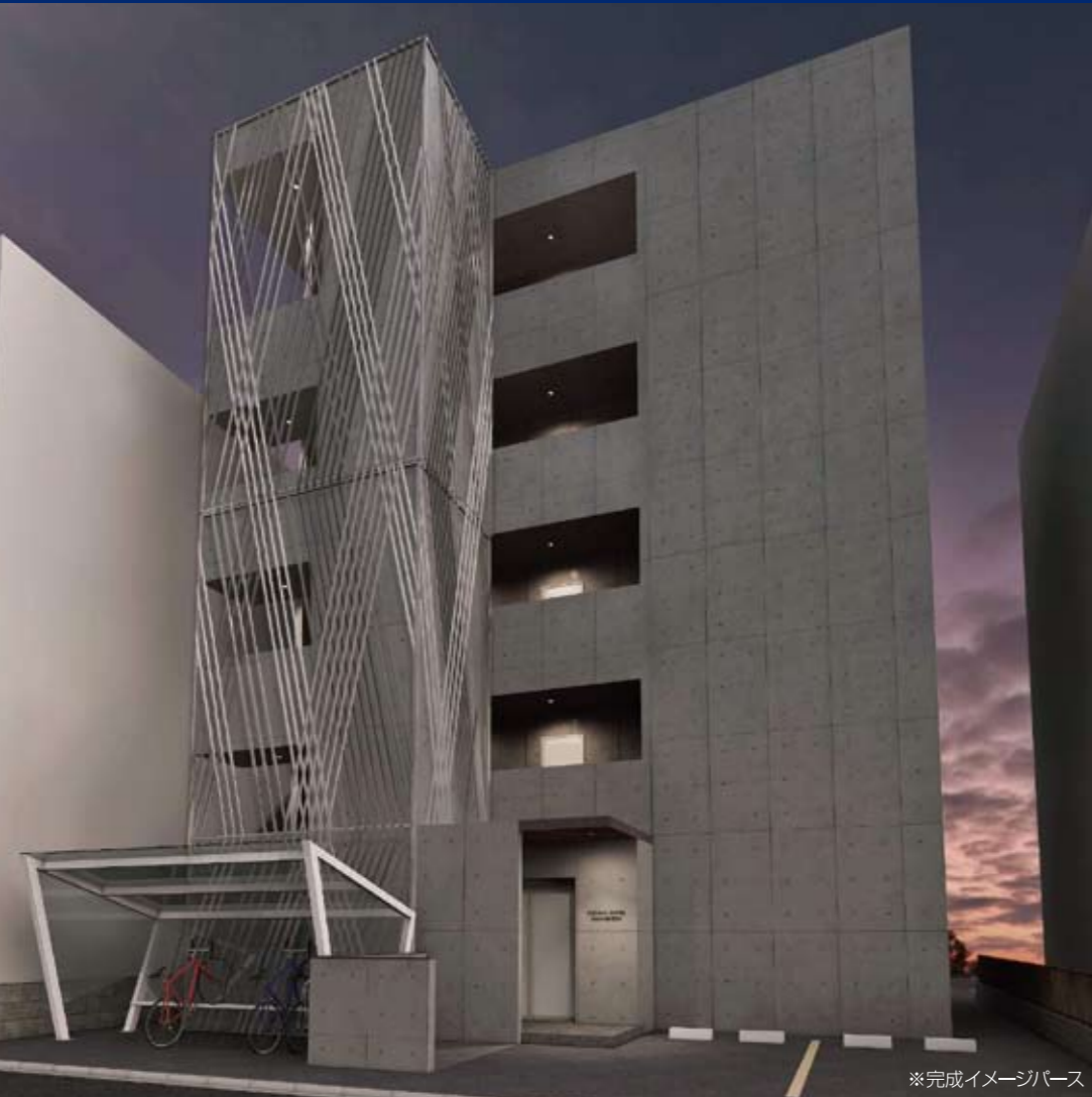
※完成イメージパース